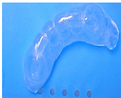
Gouttières de fluoruration